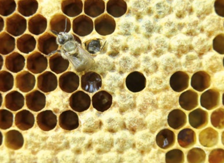
líhnoucí se mladušky