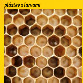
plástev s larvami