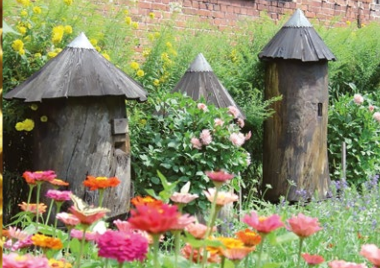
skanzen ve Swarzędzu