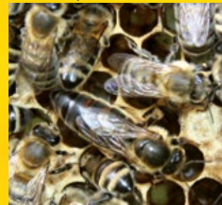
včelí matka při kladení

Včely jsou jedním z nejprozkoumanějších druhů hmyzu, je o nich napsáno množství knih, článků, existují nádherné snímky včelího života, záznamy tanečků i různých druhů bzučení jako reakcí na podněty. Člověk se s nimi učí spolupracovat již po tisíciletí. Přesto nám některé aspekty života včelstva stále unikají. Čím více se je pokoušíme poznat a využít hospodářsky pro jejich produkty, tím více se přirozená povaha a schopnost včelstva přežít ve volné přírodě přesouvá za závoj neznáma. To vede ke stavu, jaký dnes máme: včelstva hynou, jsou oslabená, trpí řadou chorob. Včelám můžeme pomoci, jen když se od nich budeme ochotni učit. Včela je tím, kdo včelaří s člověkem.